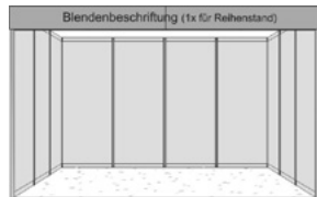
Reihen-Basisstand, 1 Seite offen