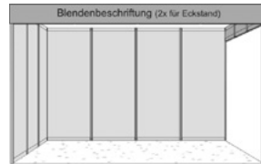
Eck-Basisstand, 2 Seiten offen