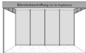
Kopf-Basisstand, 3 Seiten offen