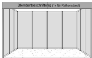
Reihen-Basisstand, 1 Seite offen