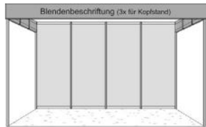
Kopf-Basisstand, 3 Seiten offen