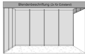
Eck-Basisstand, 2 Seiten offen