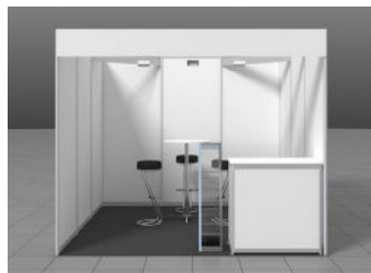
9 m 2 Reihenstand